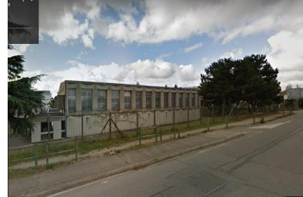
Vue du gymnase Marius Mout

Coordonnée GPS : 45°02'37.8"N 5°04'58.7"E